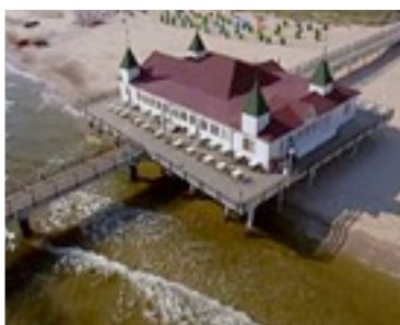
Schöne Ferien Hotelfilme über Häuser im oberen Segment auf Usedom und Mallorca - mit Hubschrauber, Dolly, Kran.