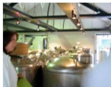
Gute Geschäfte Imagefilme im weltweiten Einsatz, bei Messen und Schauen und auf DVD im Neukundengeschäft.